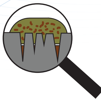
Nawilżenie przy użyciu „klasycznych” produktów do czyszczenia